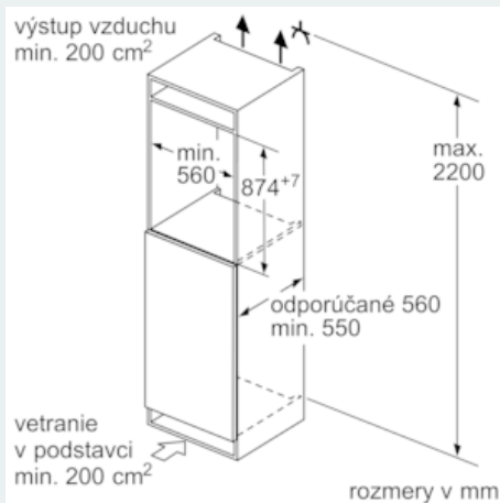
rozmery v mm

Rozmery medzier odporúčané v tabuľke je potrebné dodržiavať, aby bolo zaručené bezproblémové otváranie dverí zariadenia a nedochádzalo k poškodeniu kuchynského nábytku.