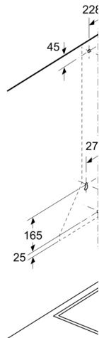
Afmeting in mm

Bij gebruik van een ac moet met het design v rekening worden gehc