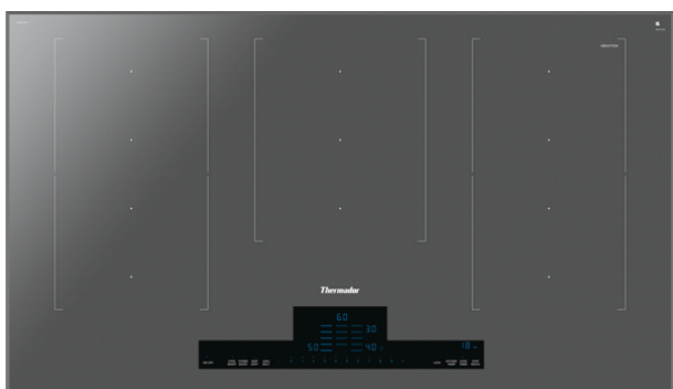
Table à induction, 36", CIT367TM