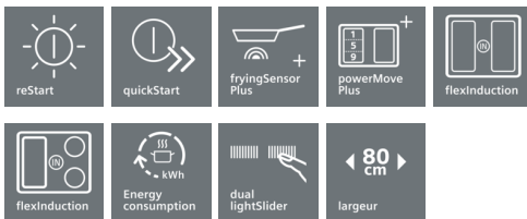
Table de cuisson à induction aux caractéristiques innovantes pour une flexibilité de cuisson accrue.