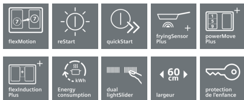
Table de cuisson à induction aux caractéristiques innovantes pour une flexibilité de cuisson accrue.