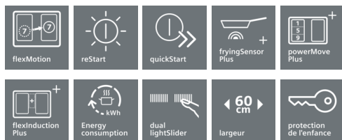
Table de cuisson à induction aux caractéristiques innovantes pour une flexibilité de cuisson accrue.