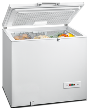
GC24MAW30 November 2011