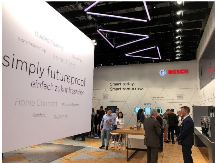
博世家电“家居互联”展区

(2018年8月30日，慕尼黑/柏林) 如何树立互联厨房数字服务领域的品牌领导力？如何发展新型数字商业模式？博西家电及旗下品牌将在今年 IFA 柏林国际电子消费品展上为您揭晓答案。