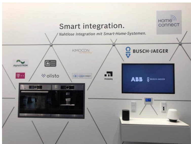
家居互联生态系统日趋完善

家居互联作为一个开放性平台，是博西家电数字化生态系统的核心，也是其在互联厨房领域提升用户体验的关键。这一跨品牌平台已在全球 33 个国家进行应用推广，并持续进行合作伙伴、产品及解决方案的整合。今年，家居互联不仅会在博世家电和西门子家电展台亮相，更将首次作为独立的品牌在两个展台之间的连接区域展出。这体现了家居互联品牌的整体化战略布局对于数字化生态系统稳定发展的重要性。2018 年，家居互联平台将自动配送服务作为重点，为使用互联家电的消费者提供更多的便捷体验。例如，目前已经通过生态系统内的合作伙伴实现了洗涤块、洗涤剂或洗碗盐的一键复购。今年将有更多产品的复购服务上线，包括订购清洁剂、吸尘器尘袋、滤水器等。