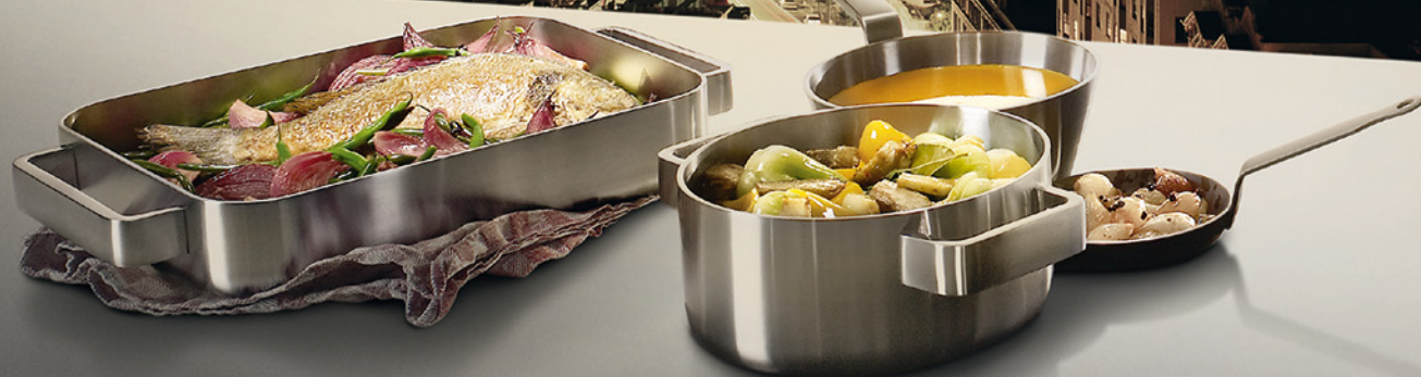
Table de cuisson