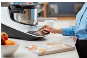
Bosch Cookit to zwycięzca testu 2023 w kategorii robotów kuchennych z funkcją gotowania