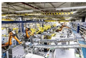
Fabryka zmywarek BSH w Dillingen.