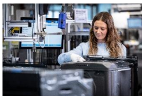
Montaż pieca w zakładzie BSH w Traunreut.