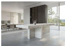
Gaggenau Essential Induction wykorzystuje innowacyjną technologię, która integruje płytę grzewczą z przestrzenią roboczą.