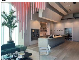
Centrum doświadczeń i projektowania BSH w Miami.