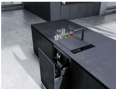
Die Weltneuheit Solitaire – The Waterbase verändert das Küchendesign und ermöglicht die Transformation von Küche in Raum.