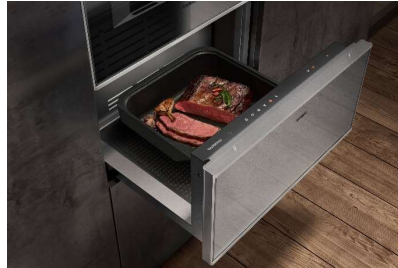
Die multifunktionale Wärmeschublade von Gaggenau – perfekt zum Sanftgaren.