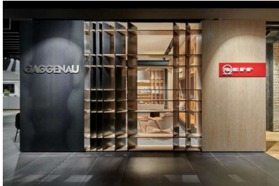
Gelungener Messeauftritt auf der Küchenmeile Germany im house4kitchen für Gaggenau, NEFF und Solitaire.