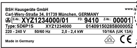
Example of rating plate with E-Nr and FD

Your JUNKER Customer Service for Domestic Appliances