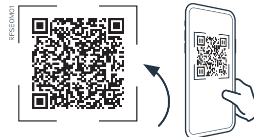
Dein QR-Code | hier scannen

Du hast Fragen oder möchtest dich an die Home Connect Service Hotline wenden? Besuche uns auf www.home-connect.com