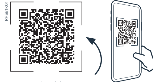
Dein QR-Code | hier scannen